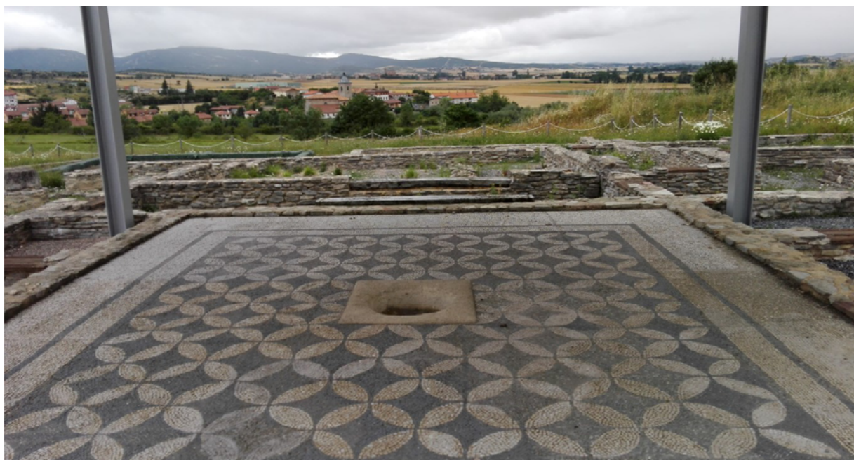
Detalle ciudad romana Iruña-Veleia