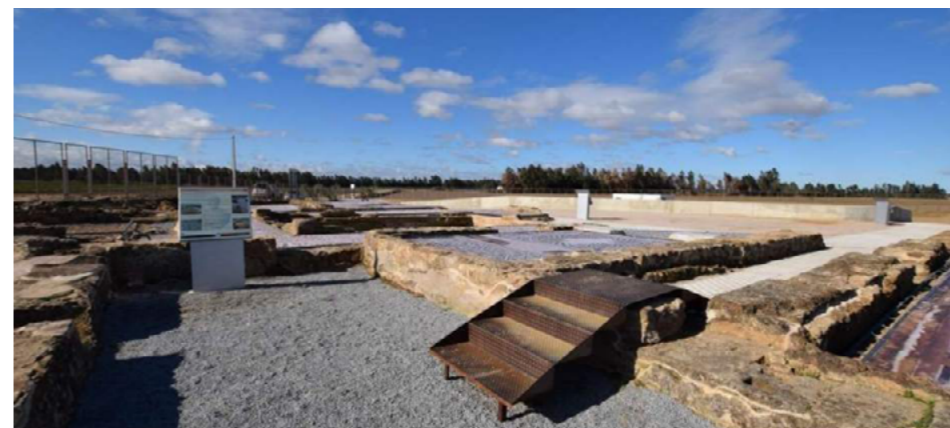
Villa romana de La Majona

Una vez dicho esto, a continuación se proponen algunos ejemplos de los más importantes yacimientos arqueológicos visitables de vías, villas o ciudades de la época romana que se encuentran en las inmediaciones o en el propio recorrido de los Caminos Naturales, y que permitirán a sus usuarios, mediante su visita, acercarse a un conocimiento de los modos de vida y costumbres de los habitantes de nuestro territorio hace más 2000 años.