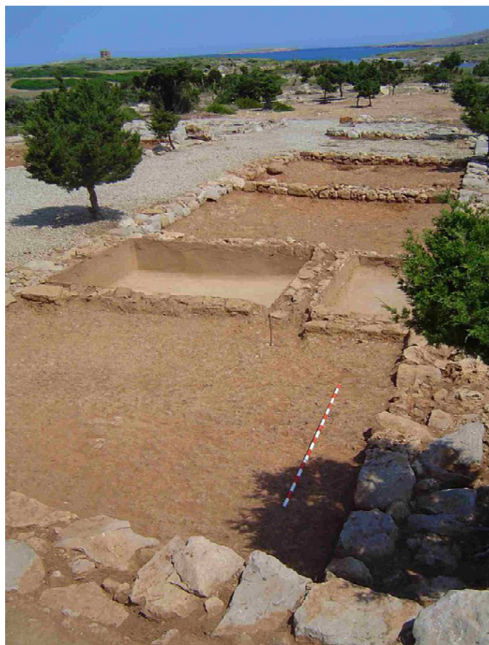
Yacimiento de Sanicera

Estos son solo algunos pequeños ejemplos que demuestran que no por muy repetido y gastado que esté, deja de ser menos cierto que nuestro territorio ha recibido una gran influencia del mundo romano en toda su superficie. Así, esperamos que al recorrer los Caminos Naturales de España el viajero tenga la posibilidad de visitar algunos de los lugares más emblemáticos que, desde hace más de 20 siglos, se han conservado y pertenecen al patrimonio arqueológico del que somos herederos.