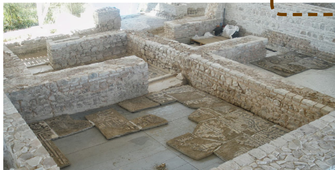
Detalle villa romana de Fuente Álamo

El Camino Natural Vía Verde del Aceite (tramo Moriles-Campo Real) extiende su trazado a lo largo de una antigua línea de ferrocarril del siglo XIX que comunicó Linares (Jaén) con Puente Genil (Córdoba), que fue utilizado principalmente para el transporte de aceite. Al finalizar el trayecto, en el apeadero de Campo Real (Puente Genil), nos encontramos con la posibilidad de visitar uno de los yacimientos de la época romana de mayor entidad del sur peninsular, la Villa Romana de Fuente Álamo . Localizado en un paraje natural, situado a sólo 3 km del casco urbano de Puente Genil en la carretera CV-297, este yacimiento destaca especialmente, por su interesante y amplio conjunto de pavimentos musivos (mosaicos). El gran número de pavimentos de mosaico encontrados, y aún más los que están por aparecer, nos indica inequívocamente la importancia de la Villa, así como de los gustos, poder adquisitivo y status social del propietario de la finca.