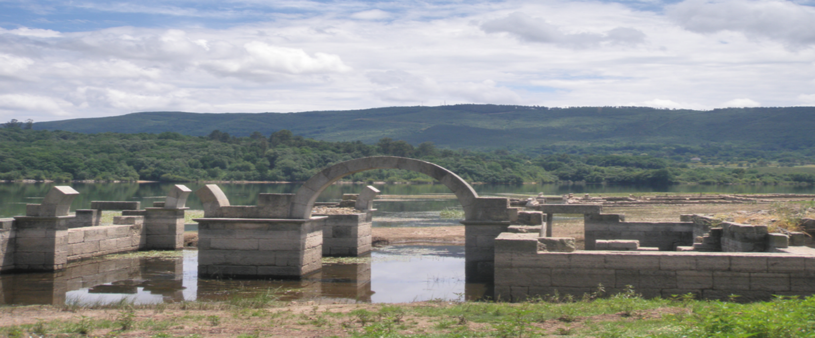
Entrada campamento Aquis Querquennis