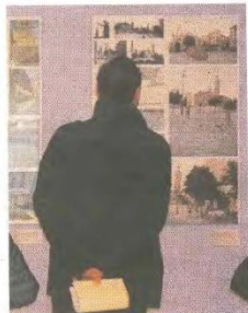
Muestra inaugurada ayer

El mundo rural evolucionó notablemente en la posguerra. Llegaron los tractores y salieron muchos hombres y mujeres huyendo del duro trabajo en el campo y buscando el pan en las ciudades. Todo eso está representando en la exposición Senderos de memoria. Una mirada a la España rural: 1948-1968 , que desde mañana sábado se puede ver en el Castillo de Mora de Rubielos.