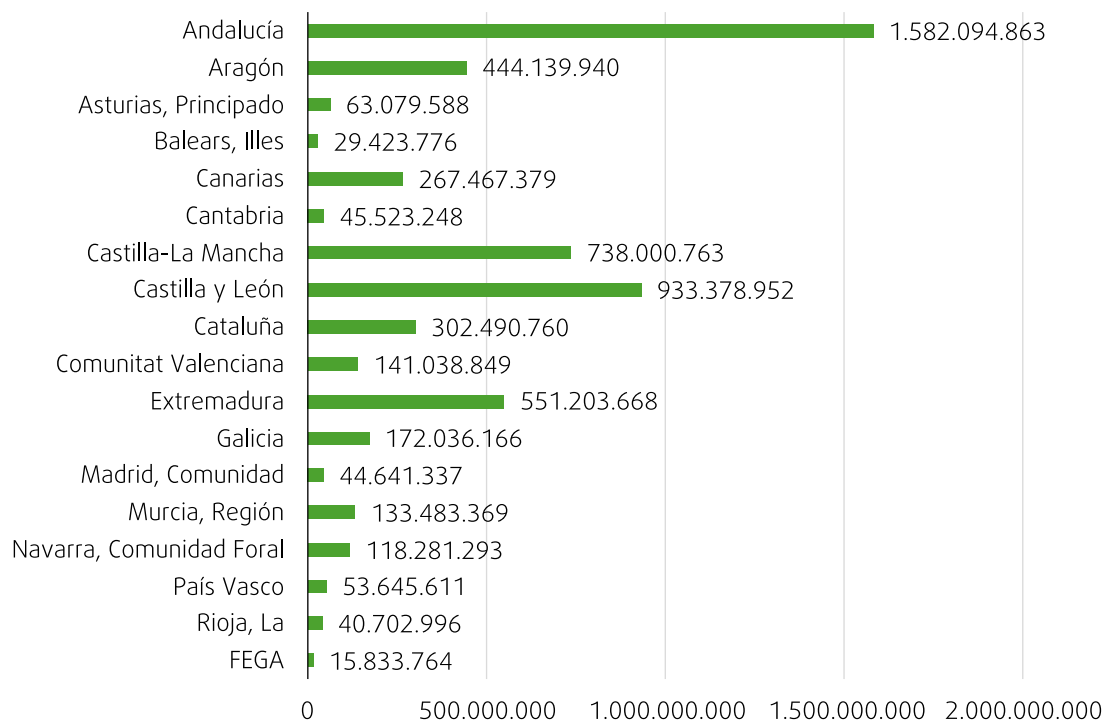
GRÁFICO 21. Feaga. Pagos por organismo pagador, 2023 (en euros)