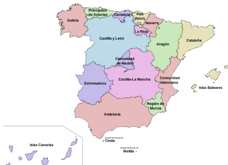
Mapa político de España con las CCAA y Ciudades autónomas

A su vez, en cada provincia existe una Jefatura o Delegación Provincial de Agricultura y Ganadería, dependiente del Servicio de Sanidad Animal de cada Comunidad Autónoma, de la que dependen las Unidades Veterinarias Locales (UVL) en el ámbito comarcal.