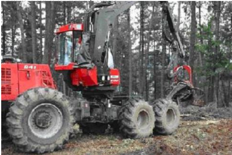
Tractores forestales con cabezal procesador