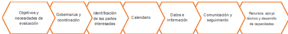
Gráfico 1. Estructura mínima del plan de evaluación