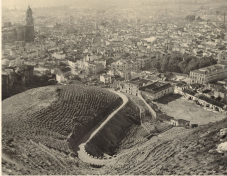
Cibralfaro. Cerro de la Plaza de Santa María. Málaga. 1941.