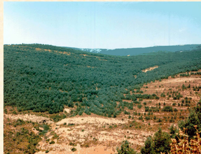
Vista del monte nº 339 U. P. Agosto 1991. Soria.