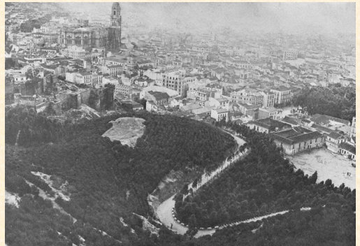
Cerro de la Plaza de Santa María corregida y repoblada con pino y eucalipto de 8 años de edad. 1948. Martínez Falero.

Aunque la base geomorfológica del territorio se mantiene, la cubierta vegetal instalada se acomoda e interacciona con ella, produciendo paisajes muy diferentes al de partida. Las fotografías originales marcan el punto de referencia a partir del cual se ha reconstruido un paisaje de calidad, más biodiverso, equilibrado y capaz de satisfacer la estabilidad hidrológica de la cuenca o ladera.