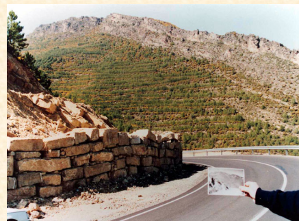
Vista de la Finca de Mas del Baile. Montán. Castellón. 1996