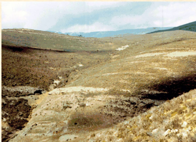
Vista del monte nº 339 U. P. Marzo 1969. Soria.

Aunque la base geomorfológica del territorio se mantiene, la cubierta vegetal instalada se acomoda e interacciona con ella, produciendo paisajes muy diferentes al de partida. Las fotografías originales marcan el punto de referencia a partir del cual se ha reconstruido un paisaje de calidad, más biodiverso, equilibrado y capaz de satisfacer la estabilidad hidrológica de la cuenca o ladera.