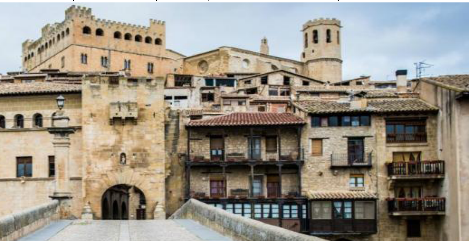
Municipio de Valderrobres.

La ruta nos lleva ahora hasta un lugar en el que el olor a uva embriaga cada esquina. Se trata del pueblo de Briones , en La Rioja, que cuenta con cerca de 800 habitantes y está situado a apenas 35 km de Logroño. Briones cuenta con un vasto patrimonio cultural y natural muy vinculado durante toda su historia con la producción de vino. Su posición estratégica en la región hizo que antaño toda la villa se encontrase amurallada para defenderla de los posibles ataques enemigos. Hoy aquella fortaleza es historia, pero se conservan los restos de la torre del castillo de Briones, que datan del siglo XIII. En las proximidades de la localidad encontraremos la etapa 13.1 del Camino Natural del Ebro GR 99 , que nos permitirá bucear por estas tierras. El inicio de este tramo del recorrido se sitúa a menos de diez kilómetros del municipio, en la vecina localidad de Haro. Transitando este sendero es posible apreciar las vistas que brinda el patrimonio de Briones a distancia, disfrutando de la estampa que dibujan sus monumentos y las ermitas que salpican los alrededores del municipio.