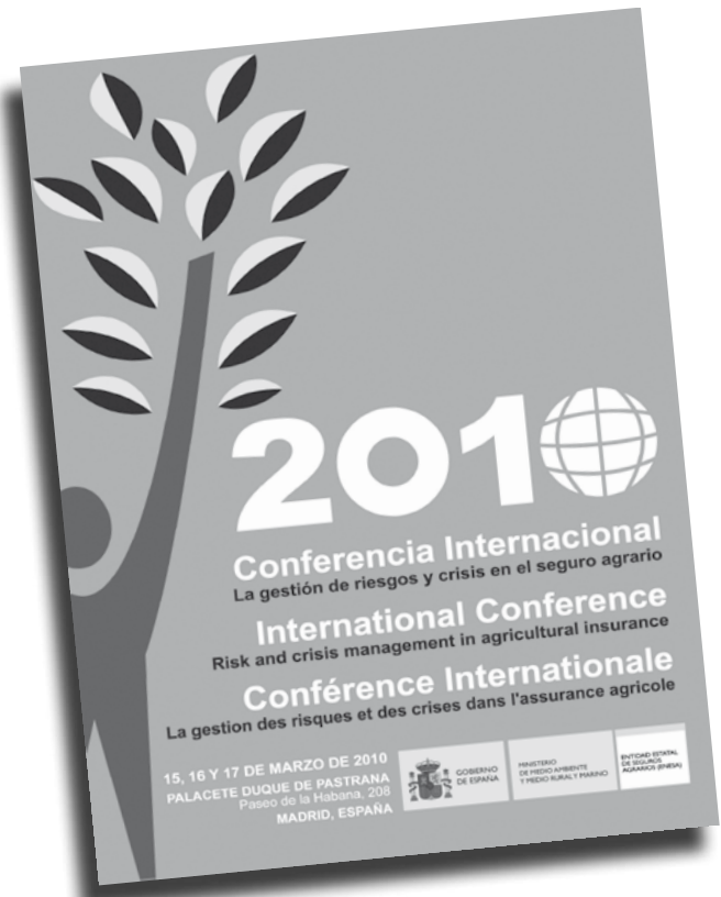
Programa Conferencia Internacional

El punto de vista de los aseguradores se expuso por representantes de la Asociación Latinoamericana para el Desarrollo del Seguro Agropecuario (ALASA), Asociación Internacional de Aseguradores de la Producción Agrícola (AIAG), del Comité Europeo de Aseguradores (CEA) y de la Agrupación Española de Entidades Aseguradoras de los Seguros Agrarios Combinados (Agroseguro).