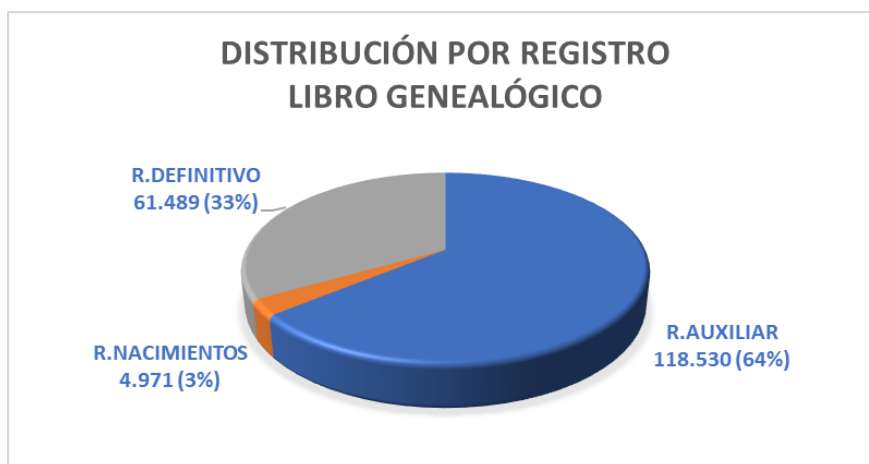
Figura 1. Distribución porcentual de los distintos Registros del Libro Genealógico