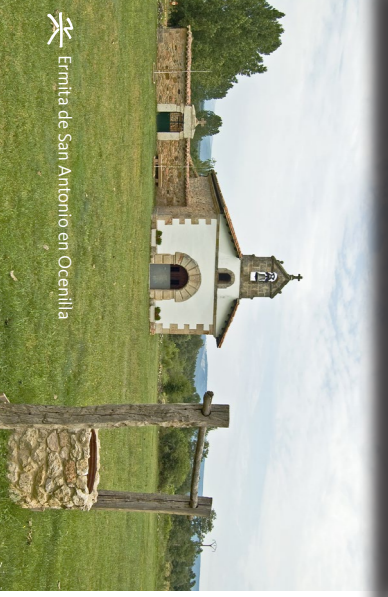
Ernita de San Antonio en Ocenilla