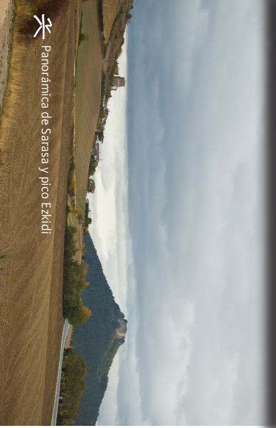
Panorámica de Sarasa y pico Ezkidi