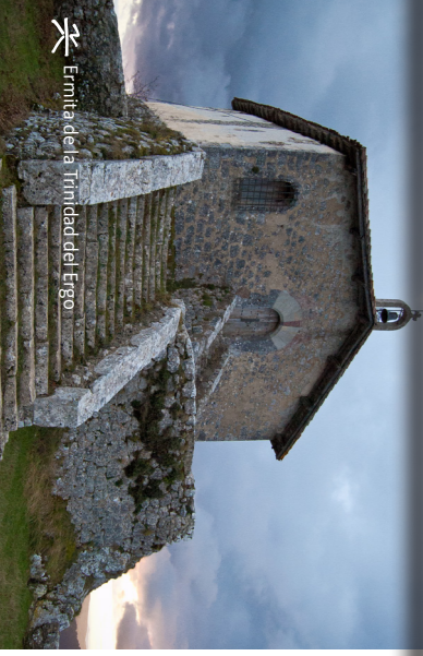
Ermita de la Trinidad del Ergo