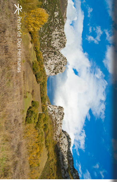
Peñas de Dos Hermanas