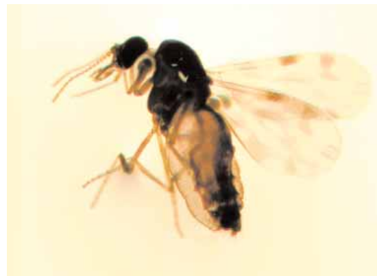
Facultad de Veterinaria de Zaragoza.