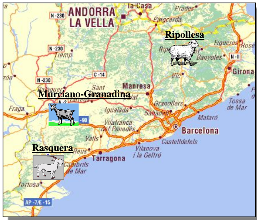
Ilustración 5.- Mapa de Cataluña con las localizaciones marcadas