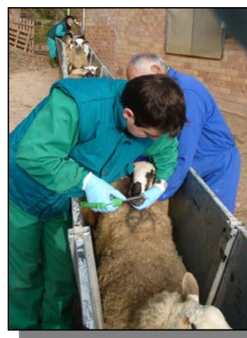
Ilustración 4.- Aplicación de dispositivos

Los animales fueron identificados por técnicos expertos en identificación electrónica ( Ilustración 4 ), con capacidad y experiencia probadas en la aplicación de dispositivos electrónicos.