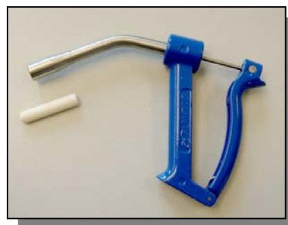
Ilustración 7.- Minibolo de 20 g Rumitag y su pistola de aplicación.

Los dispositivos de identificación utilizados fueron los reflejados en la tabla 1 .