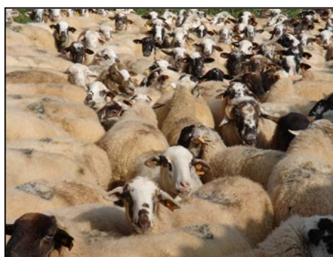
Ilustración 3.- Ovejas de la raza Ripollesa