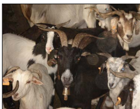
Ilustración 2.- Cabras de la raza Blanca Rasquera