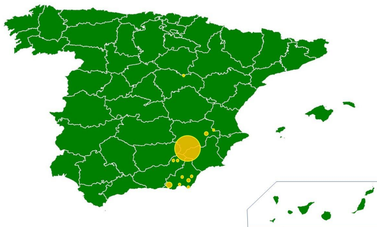
Imagen 1. Mapa de distribución de las ganaderías asociadas a AGRACE a octubre de 2018.

Según se observa en la imagen 1, parece existir una distribución norte-sur, en un espacio rectangular cuyos vértices superiores estarían entre el término municipal de Alcolea del Pinar