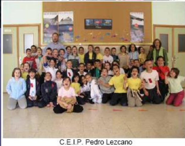
C.E.I.P. Pedro Lezcano

-Recurso didáctico: “Miniguía de los Peces, Crustáceos y Moluscos de Canarias”