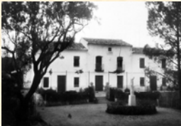
Casa Forestal de la Huerta de Espuña. Sª España. Murcia