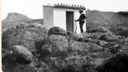
Garita de vigilancia. Sª España. Murcia. 1896.