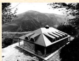
Refugio de la Estación Invernal de Ezcaray. La Rioja. 1960. Sebastián Soto García.