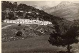
Vista de campamento de obreros en el monte de Sª Umbía. Iznalloz. Granada.