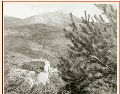
Casa de Monterrey. Laujar de Andarax. Almería. 1954.