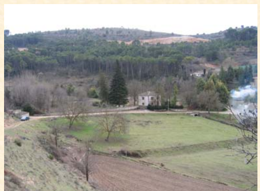
Casa Forestal del Vivero de Tendilla. Guadalajara. 2004. Jesús Blanquer.