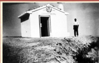
Casa Forestal en monte Fraile y Estallador. Biar. Alicante. 1949.

Su arquitectura no suele ser muy cuidada pero sus emplazamientos casi siempre son espectaculares.