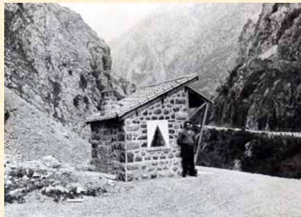
Refugio de pescadores en Cantabria.