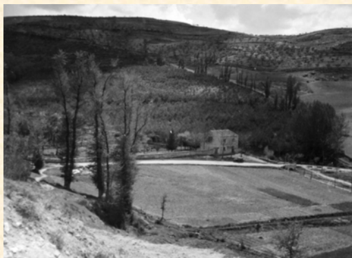
Casa Forestal del Vivero de Tendilla. Guadalajara. 1941.