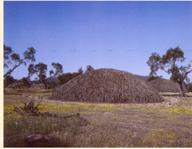
Formación de carboneras. Badajoz. 1987.