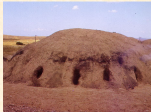
Horno de carboneo. Badajoz. 1987.