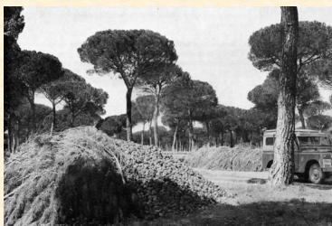
Cosecha de piñas, después de un tratamiento contra plagas en el monte Ontorio. La Parrilla. Valladolid. 1966.