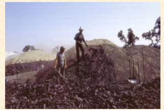
Saca de carbón. Badajoz. 1987.