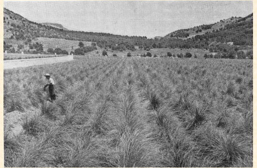
De este áspero pero espléndido criadero de atochas, se obtiene semilla seleccionada para la regeneración de espartizales de la regeneración murciana. 1957.