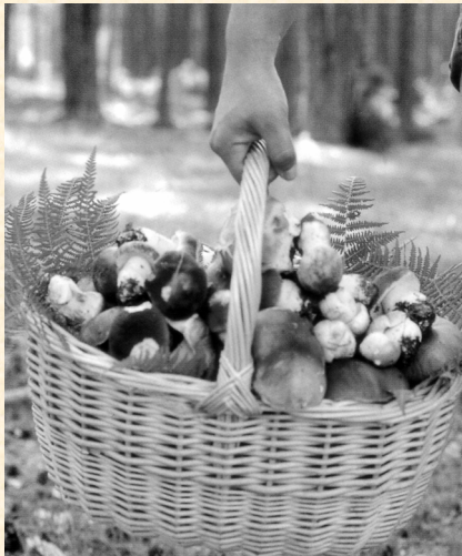
Hongos. F. Martínez Peña.