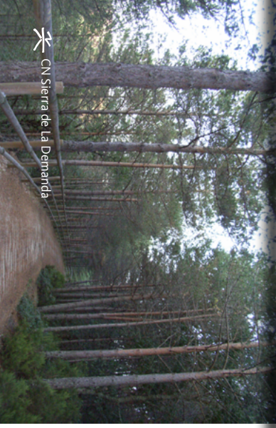
CN Sierra de la Demanda