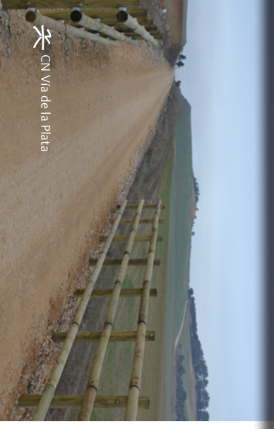
CN Vía de la Plata

Santander-Mediterráneo (SO). Este se enmarca en la histórica conexión entre la cornisa cantábrica y el mar Mediterráneo, y discurre entre comarca soriana de Pinares hacia la capital de la provincia.