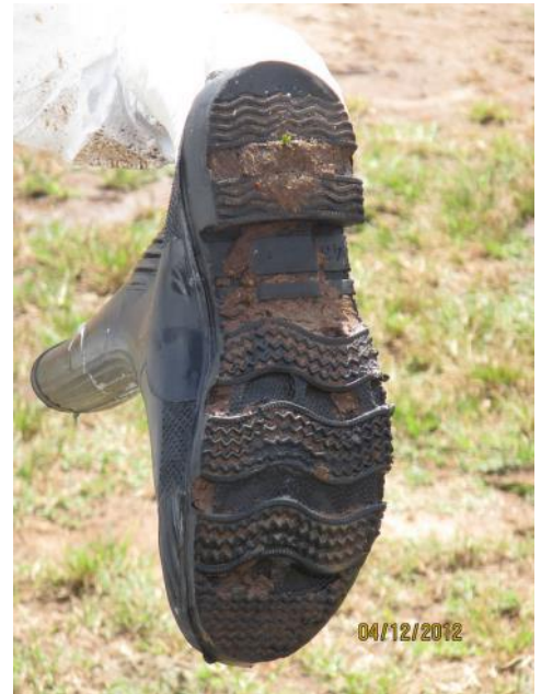
El personal es un importante factor de riesgo para la propagación del VFA.