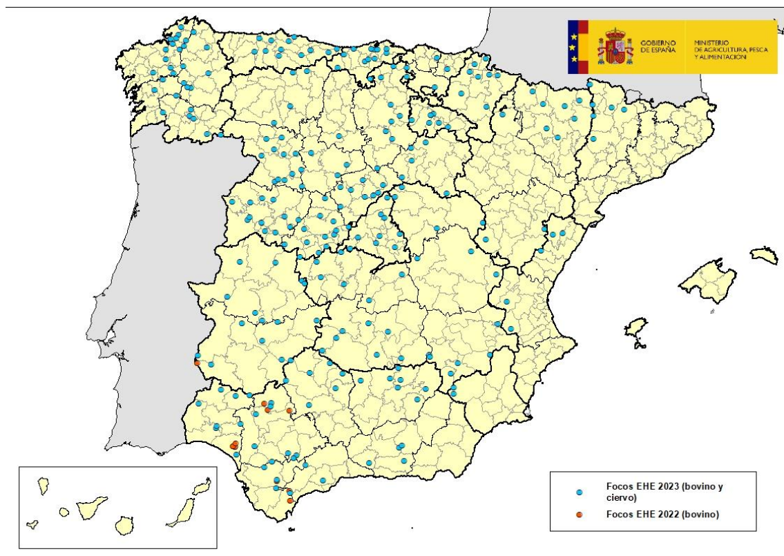
Mapa 1: Comarcas afectadas por EHE en España en años 2022 y 2023

Desde la última actualización sobre la enfermedad realizada el pasado 08 de noviembre, el Laboratorio Central de Veterinaria (LCV) de Algete, laboratorio nacional de referencia para esta enfermedad, ha confirmado casos de enfermedad hemorrágica epizootica (EHE) en 12 nuevas comarcas. Todos ellos se han detectado en explotaciones de bovino en las comarcas de: Arzúa, Ortegal, Santiago de Compostela, Teixeiro y Terra de Melide (A Coruña); A Mariña Occidental, Os Ancares y A Ulloa (Lugo); A Limia y Ribadavia (Ourense); Tabairós-Terra de Montes (Pontevedra) y Huesca (Huesca). Ver mapa 1.