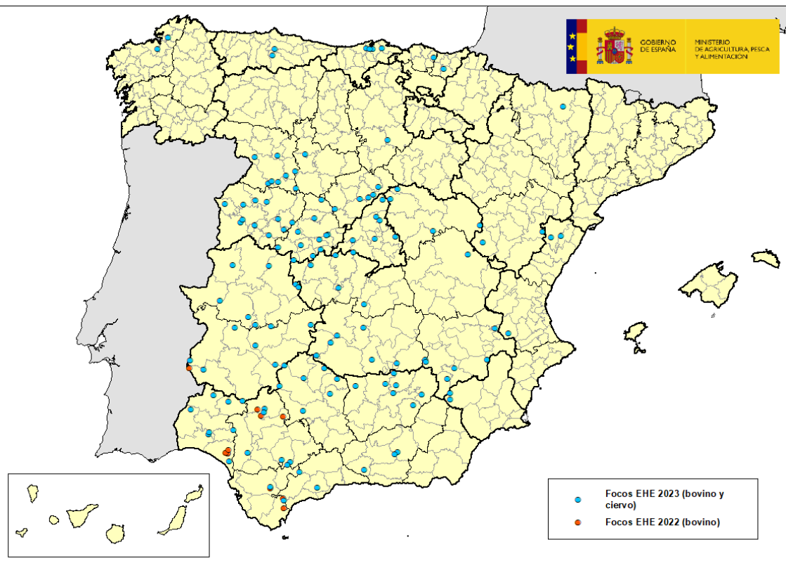
Mapa 1: Focos de EHE en España en años 2022 y 2023

Desde la última actualización sobre la enfermedad realizada el pasado 11 de septiembre, el Laboratorio Central de Veterinaria (LCV) de Algete, laboratorio nacional de referencia para esta enfermedad, ha confirmado 23 nuevos casos de enfermedad hemorrágica epizootica (EHE). De ellos, 20 se han detectado en explotaciones de bovino en las comarcas de Arévalo, Cebreros y El Barraco (Ávila); Manganeses de la Lampreana y Alcañices (Zamora); Cantalejo y Sepúlveda (Segovia); Medina del Campo, Tordesillas y Medina de Rioseco (Valladolid); Salas de los Infantes (Burgos); Gama - Bárcena de Cicero (Cantabria); Gijón (Asturias); Santa Fe-Vega de Granada (Granada); Els Ports (Castellón); Alcalá de Henares y San Martín de Valdeiglesias (Madrid); Bizkaia (Bizkaia); y A Coruña y As Pontes (A Coruña). Asimismo, se han detectado 3 casos en ciervos en las comarcas de Baix Maestrat - Sant Mateu (provincia de Castellón); en Villacastín (Segovia) y Santander (Cantabria). Ver mapa 1.