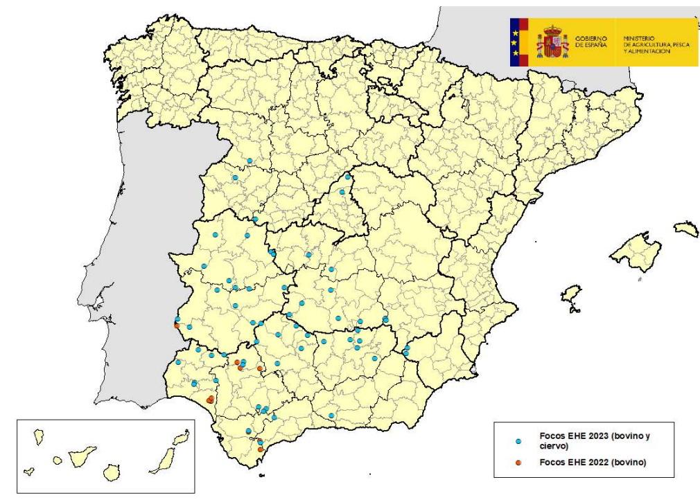
Mapa 1: Focos de EHE en España en años 2022 y 2023

Desde la última actualización sobre la enfermedad realizada el pasado 7 de agosto, el Laboratorio Central de Veterinaria (LCV) de Algete, laboratorio nacional de referencia para esta enfermedad, ha confirmado 19 nuevos casos de enfermedad hemorrágica epizootica (EHE), en las comarcas de: Campiña y Campo de Gibraltar (provincia de Cádiz); Cartaya (provincia de Huelva), Posadas y Valle de Guadiato (provincia de Córdoba); El Condado, Cazorra, Linares y Úbeda (provincia de Jaén); Alhama de Granada (provincia de Granada); Mérida y Azuaga (provincia de Badajoz); Plasencia, Coria y Valencia de Alcántara (provincia de Cáceres); Colmenar Viejo y Buitrago (Provincia de Madrid); Barco de Ávila (provincia de Ávila y Zamora (provincia de Zamora). Además, se han confirmado dos focos en Murcia en ciervos silvestres en dos cotos cercanos entre sí. Ver mapa 1.