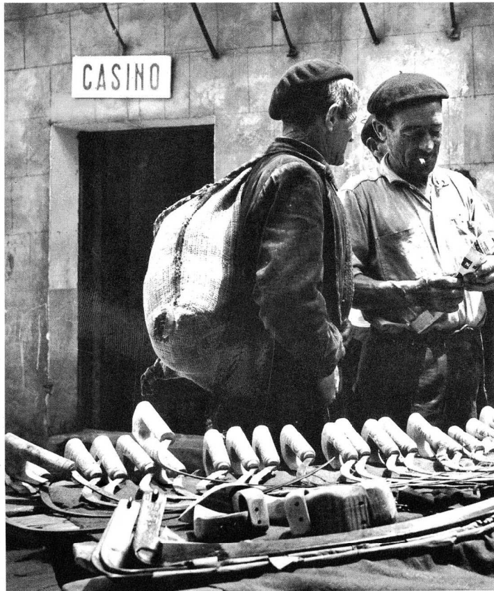
Campeños comprando herramientas en el mercado de Atienza, Guadalajara.

La exposición 'Senderos de la Memoria' se complementa con una selección del fondo documental cinematográfico histórico producido por el Ministerio desde 1927 a 1968. Una colección en celuloide que también está siendo restaurada y que se compone de películas de impagable valor histórico, estético y emocional. Muchas de ellas son filmes didácticos filmados ex profeso para dar a conocer nuevas técnicas agrícolas entre los campesinos. El ministerio trabaja también en la puesta en valor de esos materiales históricos.