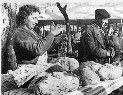
Un puesto de pan en los años 50.