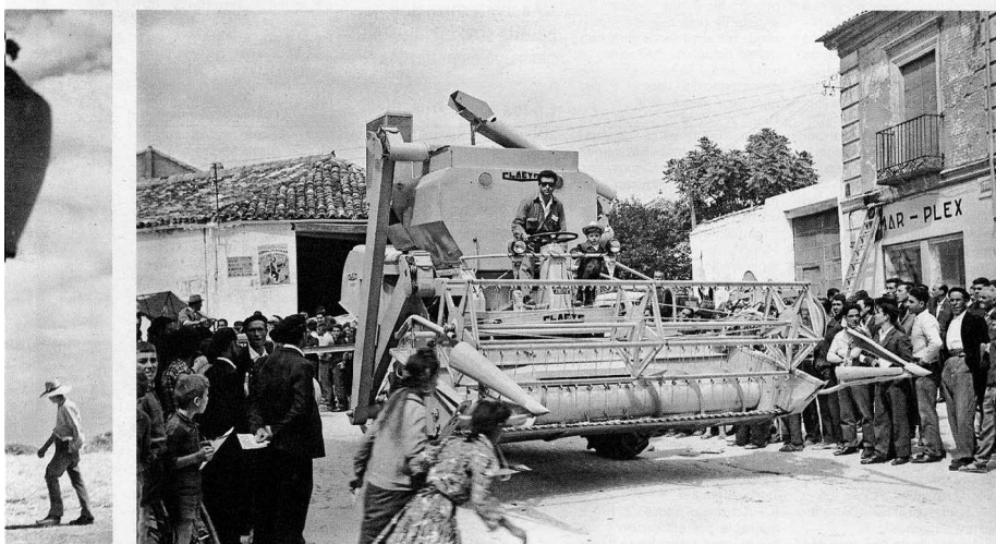
Presentación de la primera máquina cosechadora en Tarancón, Cuenca, en el año 1963.