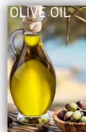
Figuras. Valores acumulados de precipitaciones en zonas agrícolas. Datos de producción, exportación, importación y consumo de aceite de oliva de los años 2017/2018 y lo que se espera del 2018/2019.

RECURSO DISPONIBLE EN https://ec.europa.eu/agriculture/markets-and-prices/short-term-outlook_en